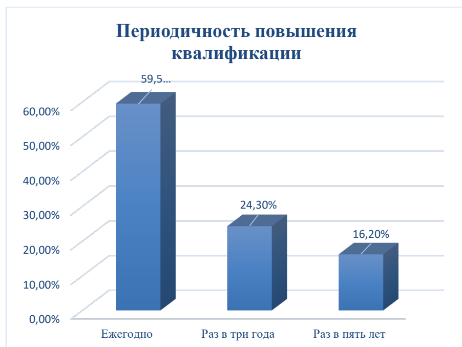
Рисунок 6. Ответ на вопрос: «С какой периодичностью вы проходите повышение квалификации»

опрошенных проходят повышение квалификации – «ежегодно», 16,2% опрошенных проходят повышение квалификации – «раз в пять лет» (рисунок 6).