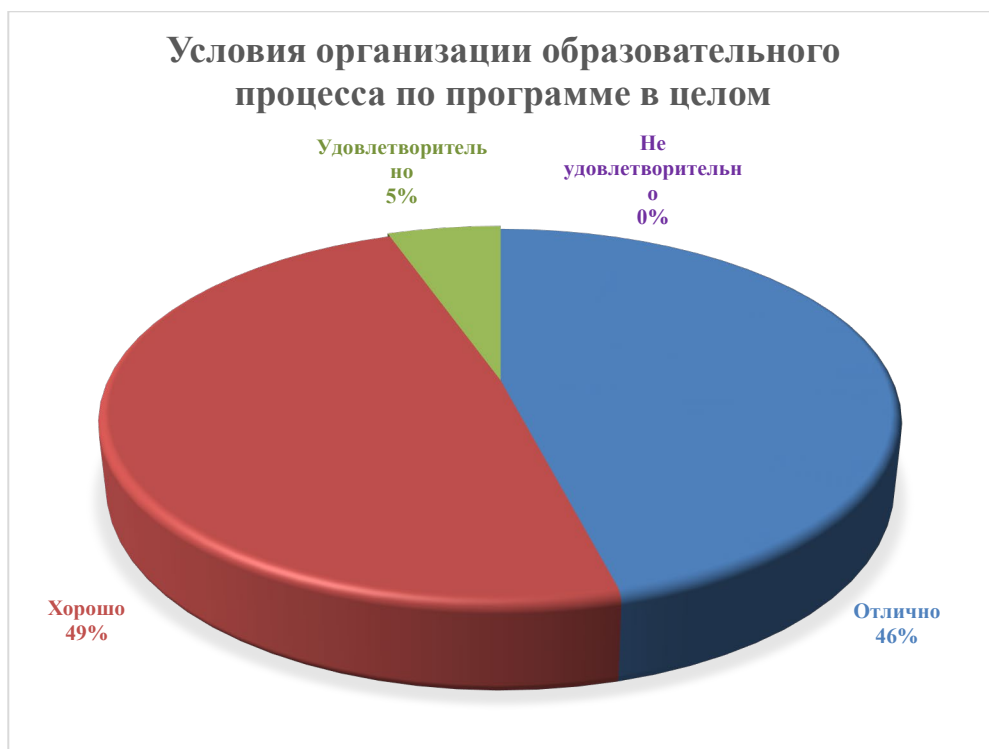
Рисунок 14. Ответ на вопрос: «Оцените, пожалуйста» условия организации образовательного процесса по программе в целом»

На вопрос 18: «Оцените, пожалуйста» условия организации образовательного процесса по программе в целом» 46 % поставили оценку «отлично», 49 % поставили оценку «хорошо», 5 % поставили оценку «удовлетворительно», оценку «неудовлетворительно» не поставил никто (рисунок 14).