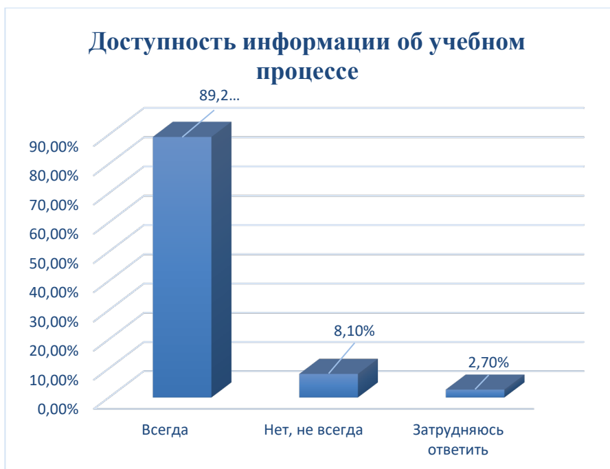
Рисунок 10. Ответ на вопрос: «Всегда ли доступна вам вся необходимая информация, касающаяся учебного процесса?»

На вопрос 14: «Всегда ли доступна вам вся необходимая информация, касающаяся учебного процесса?» 89,2% опрошенных ответили – «всегда», 8,1% опрошенных ответили – «не всегда», 2,7% опрошенных ответили – «затрудняюсь ответить» (рисунок 10).