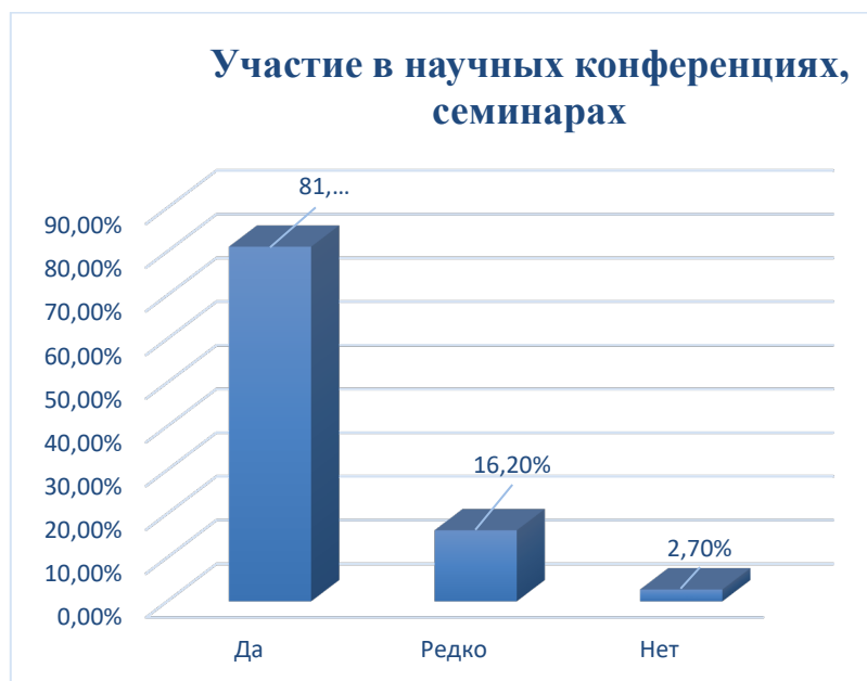
Рисунок 9. Ответ на вопрос: «Принимаете ли вы участие в научных семинарах, конференциях?»

На 13 вопрос «Принимаете ли вы участие в научных семинарах, конференциях?» 81,1% опрошенных ответили «Да», 16,2% опрошенных ответили – «Редко», 2,7 % опрошенных ответили «Нет» (рисунок 9).