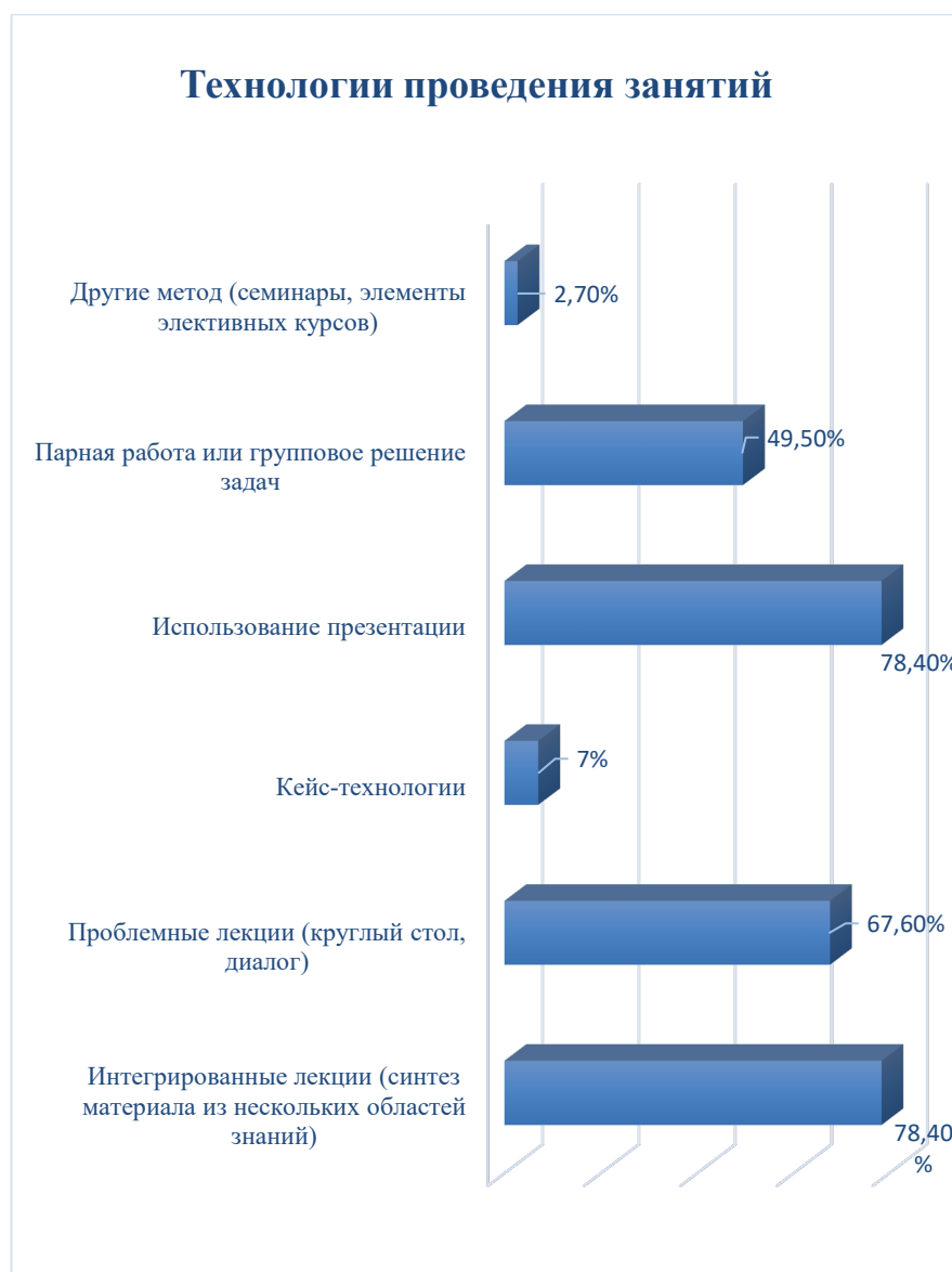
Рисунок 1. Ответ на вопрос: «Какие технологии при проведении занятий вы используете»

На вопрос 5: «Реализуется ли в семинарии учебные курсы с применением информационных технологий» 78% ответили «Да», 3% ответили «Нет», 19% ответили «Не знаю» (рисунок 2).