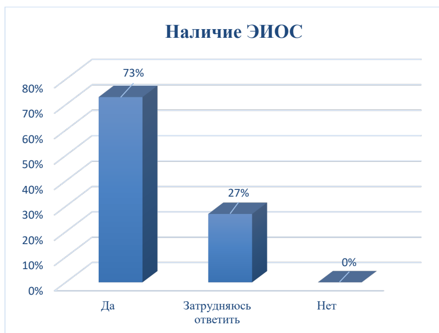
Рисунок 3. Ответ на вопрос: «Создана ли в семинарии электронная информационно-образовательная среда (ЭИОС)»

На вопрос 6: «Создана ли в семинарии электронная информационно-образовательная среда (ЭИОС)», были получены следующие ответы: «Да» – 73%, «Нет» – 0%, Затруднились с ответом 27% опрошенных (рисунок 3).