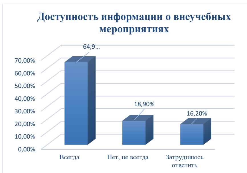
Рисунок 11. Ответ на вопрос: «Всегда ли доступна Вам вся необходимая информация, касающаяся внеучебных мероприятий?»

На вопрос 15: «Всегда ли доступна вам вся необходимая информация, касающаяся внеучебных мероприятий?» 64,9% опрошенных ответили – «всегда», 18,9% опрошенных ответили – «не всегда», 16,2% опрошенных ответили – «затрудняюсь ответить» (рисунок 11).