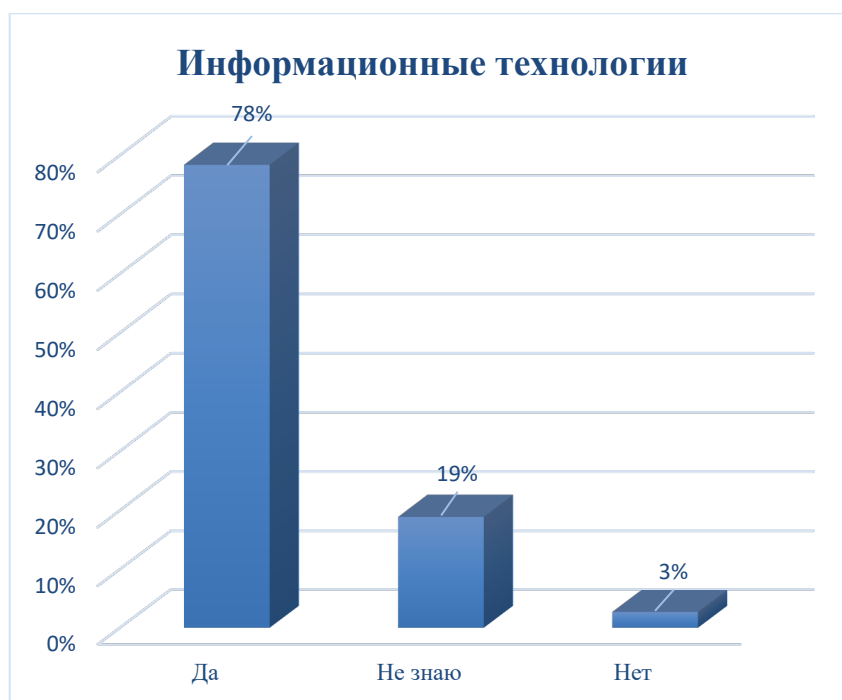
Рисунок 2. Ответ на вопрос: «Реализуется ли в семинарии учебные курсы с применением информационных технологий»

На вопрос 6: «Создана ли в семинарии электронная информационно-образовательная среда (ЭИОС)», были получены следующие ответы: «Да» – 73%, «Нет» – 0%, Затруднились с ответом 27% опрошенных (рисунок 3).