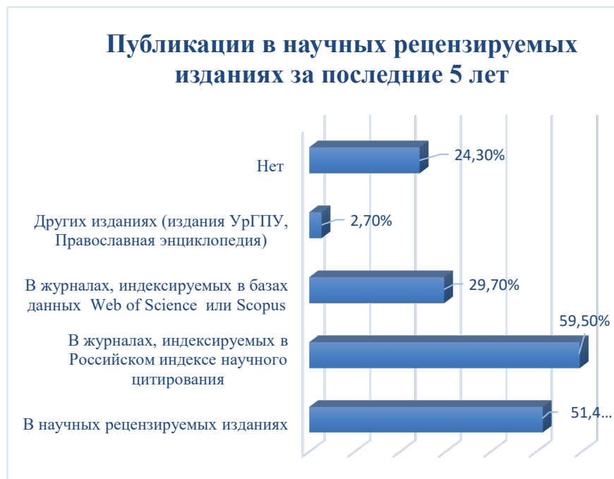
Рисунок 8. Ответ на вопрос: «Есть ли у вас публикации в научных рецензируемых изданиях за последние 5 лет? В каких?»

На вопрос 12: «Есть ли у вас публикации в научных рецензируемых изданиях за последние 5 лет? В каких?» были получены следующие ответы: «В научных рецензируемых изданиях» – 51,4 %, «В журналах, индексируемых в Российском индексе научного цитирования» – 59,5 %, «В журналах, индексируемых в базах данных Web of Science или Scopus» – 29,7 %, «Других изданиях» (издания УрГПУ, Православная энциклопедия) – 2,7 %, «Нет» – 24,3% (рисунок 8).