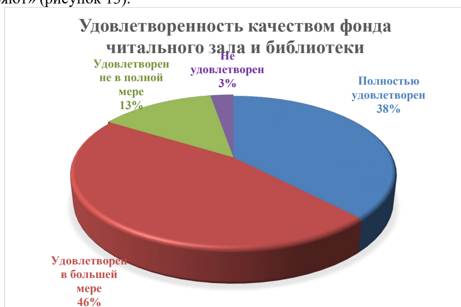
Рисунок 13. Ответ на вопрос: «Удовлетворяет ли вас качество фондов читального зала и библиотеки»

На вопрос 17: «Удовлетворяет ли вас качество фондов читального зала и библиотеки» 38% опрошенных поставили оценку «5 – удовлетворяют, 46% опрошенных поставили оценку «4 – в большей степени удовлетворяют», 13 % опрошенных поставили оценку «3 – не в полной мере», 3 % опрошенных поставили оценку «2 – не удовлетворяют» (рисунок 13).