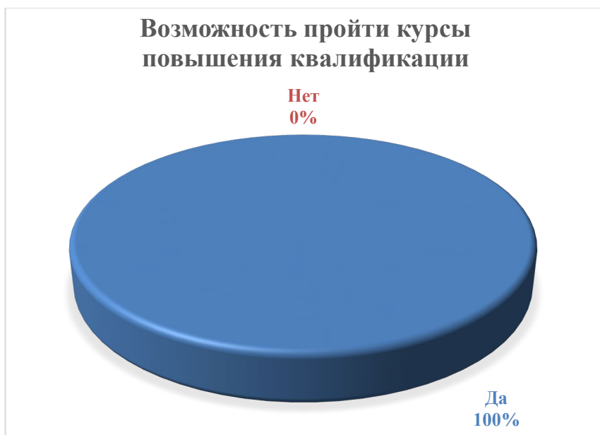
Рисунок 5. Ответ на вопрос: «Предоставляет ли вам семинария возможность пройти курсы повышения квалификации, обучающие семинары, стажировки?»

На вопрос 9: «Предоставляет ли вам семинария возможность пройти курсы повышения квалификации, обучающие семинары, стажировки?», 100% опрошенных ответили положительно (рисунок 5).