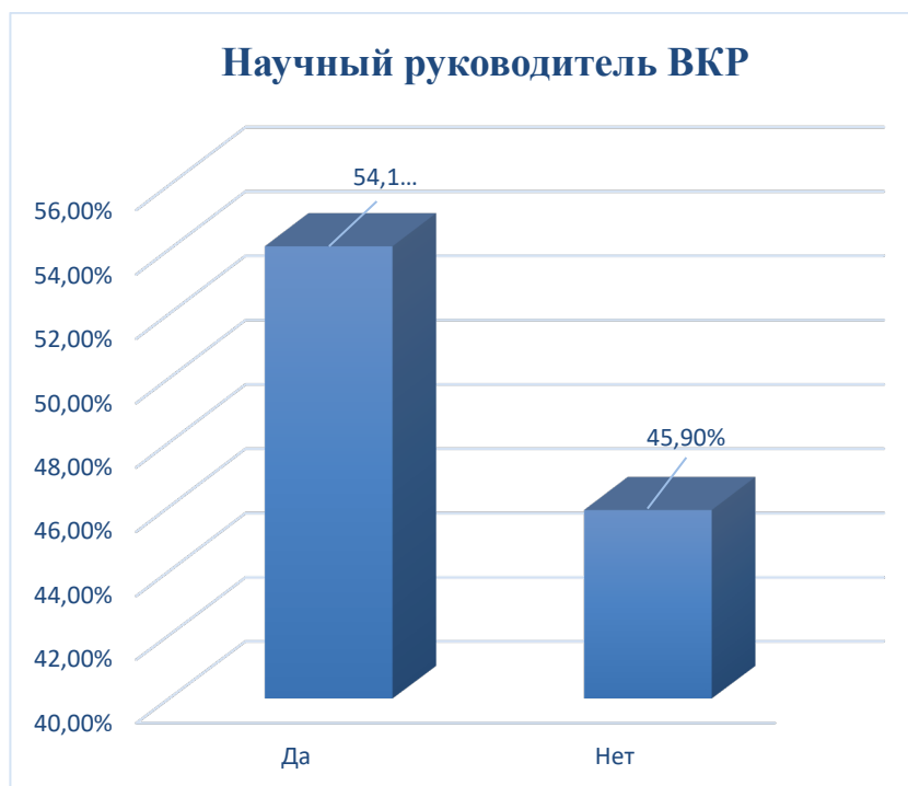
Рисунок 7. Ответ на вопрос: «Являетесь ли вы научным руководителем ВКР»

На вопрос 11: «Являетесь ли вы научным руководителем ВКР» 54,1 % опрошенных ответили – «да», 45,9% опрошенных ответили – «нет» (рисунок 7).