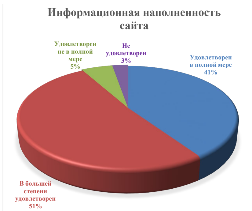
Рисунок 4. Ответ на вопрос: «Как вы оцениваете информационную наполненность сайта семинарии»

«В большей степени удовлетворен» – 51%, «Удовлетворен не в полной мере» – 5%, «Не удовлетворен» –3% (рисунок 4).