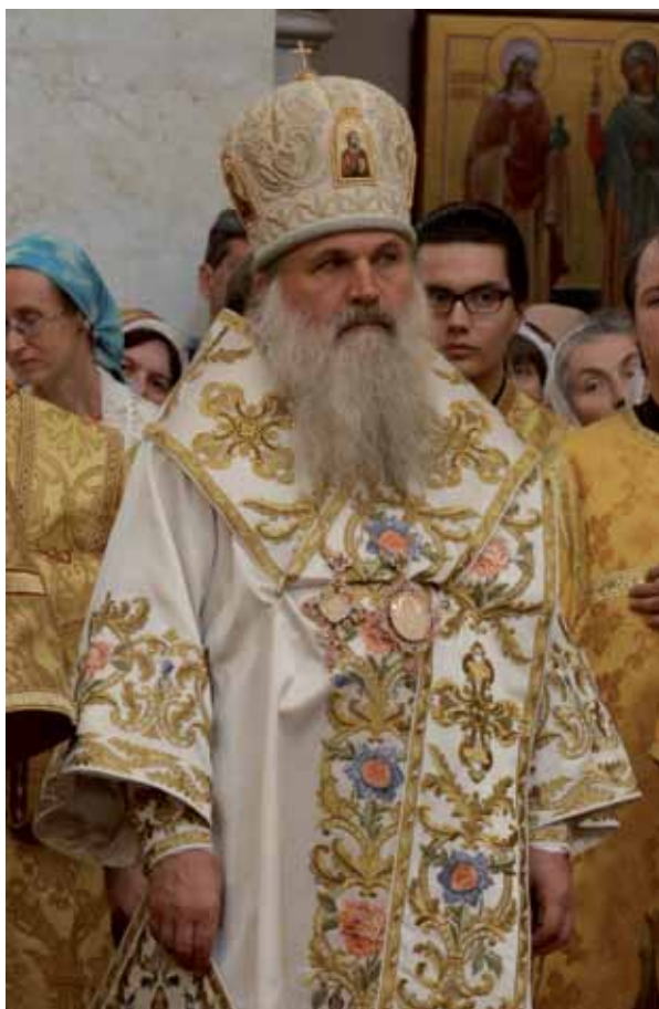
Архиепископ Екатеринбургский и Верхотурский ВИКЕНТИЙ, ректор Екатеринбургской духовной семинарии