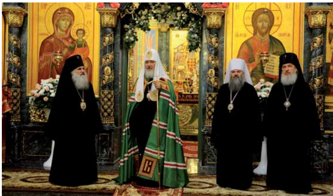
Визит Святейшего Патриарха Кирилла в Екатеринбургскую епархию. 16-18 апреля 2010 г.