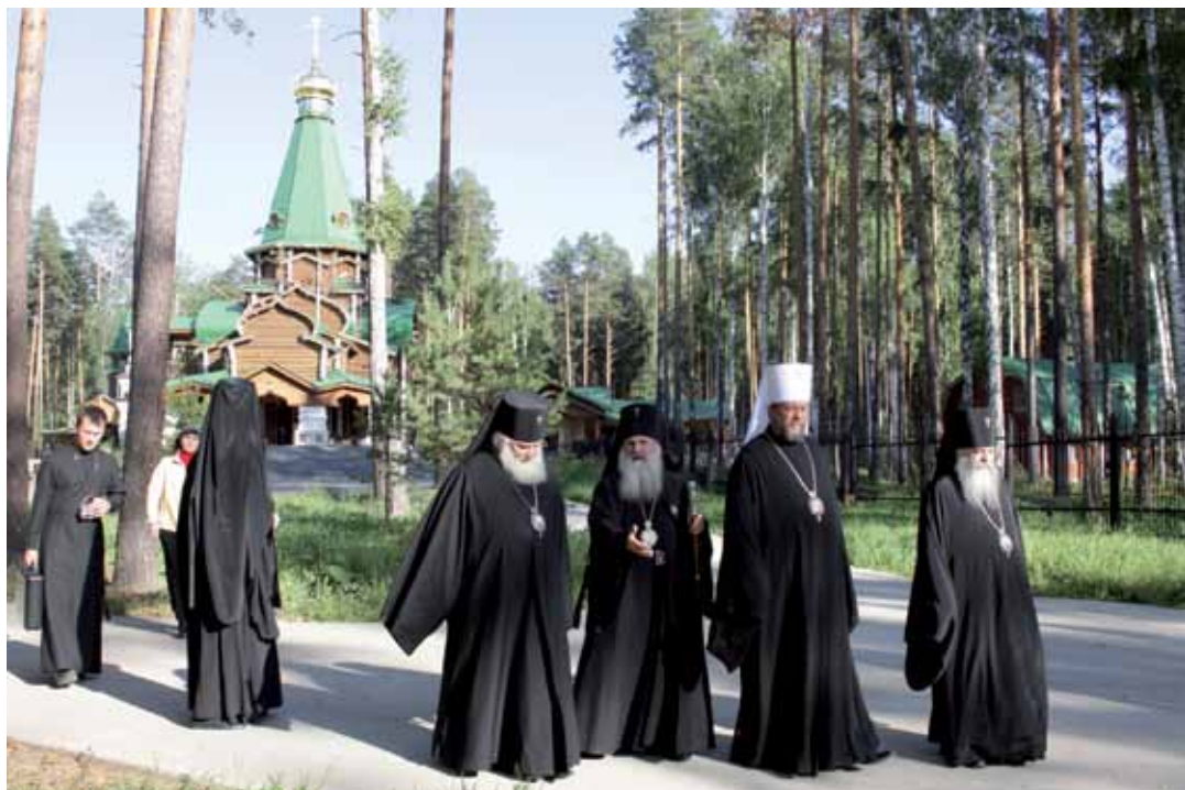
В мужском монастыре во имя святых Царственных страстотерпцев

в общеобразовательных школах работают православные группы продленного дня, в детских садах — православные группы. При больницах, социальных учреждениях, вузах открываются домовые храмы. Церковь ведет большую социальную работу.