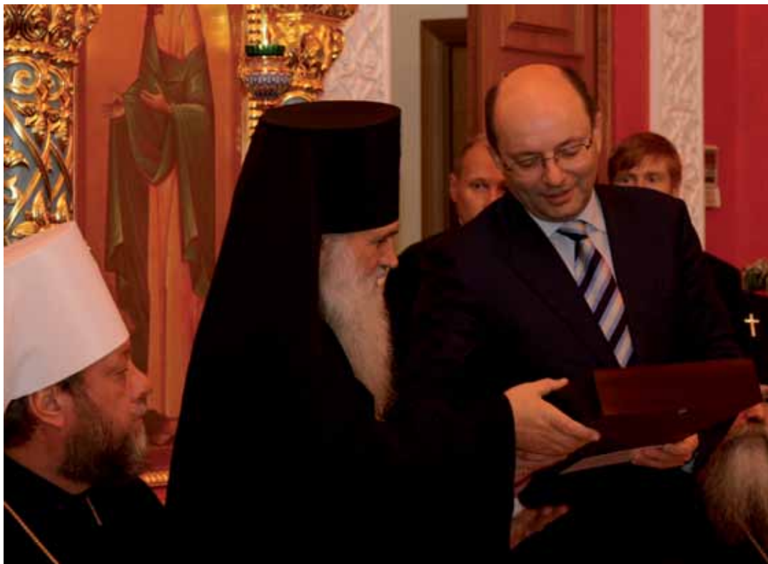
Поздравление от губернатора Свердловской области А. Мишарина