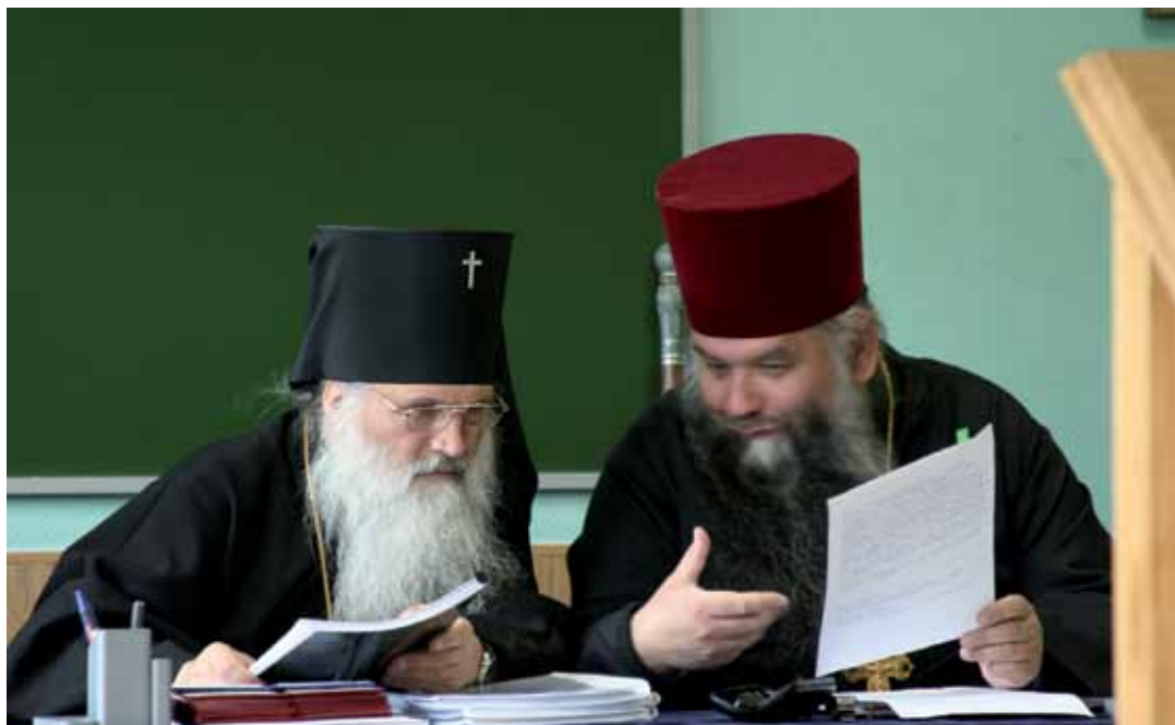
На защите дипломных работ в Екатеринбургской духовной семинарии. Июнь 2010 г.