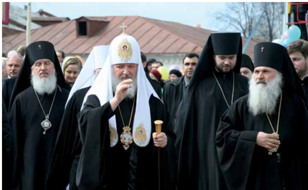
Во время визита Святейшего Патриарха Московского и всея Руси Кирилла в Екатеринбургскую епархию 16–18 апреля 2010 г. Посещение Ново-Тихвинского женского монастыря

В феврале 1999 года Святейшим Патриархом Алексием II за понесенные труды Владыка был возведен в сан архиепископа.