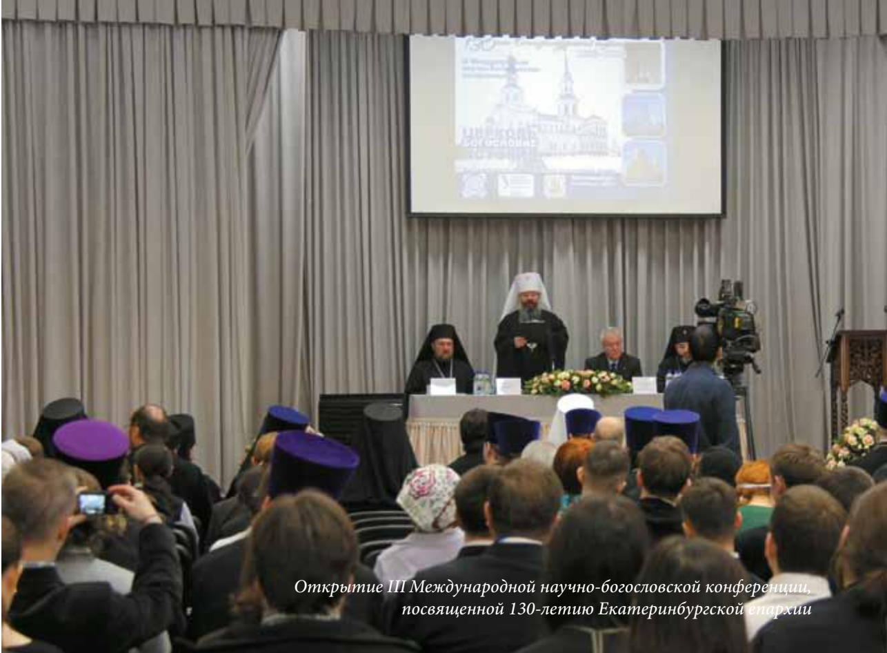
Открытие III Международной научно-богословской конференции, посвященной 130-летию Екатеринбургской епархии