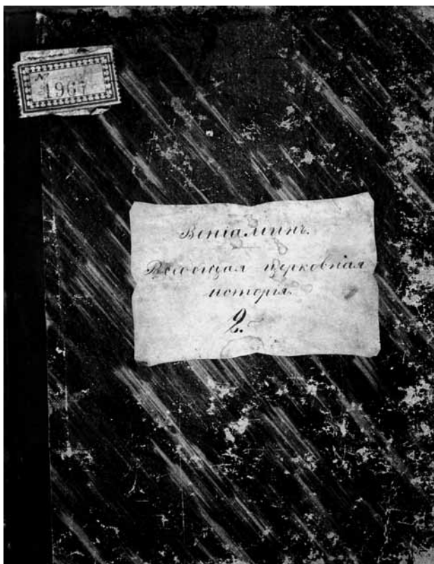
Ил. 3. Вениамин, архим. Всеобщая церковная история. Обложка

черков. Переплет из картона оклеен зеленой мраморной бумагой, корешок и уголки из зеленой ткани (ил. 3). Рукопись включает в себя изложение всеобщей истории Церкви с 622 по 1453 г. Цифра «2» на ярлыке и содержание рукописи дают основания для предположения, что имелся, как минимум, еще один том лекций архимандрита Вениамина, до нас не дошедший. Автор текста — Вениамин (Благодравов Василий Антонович, 1825–1892) 18 , окончил Тамбовскую духовную семинарию (1846) и Казанскую духовную академию со степенью магистра (1850). С 1857 г.