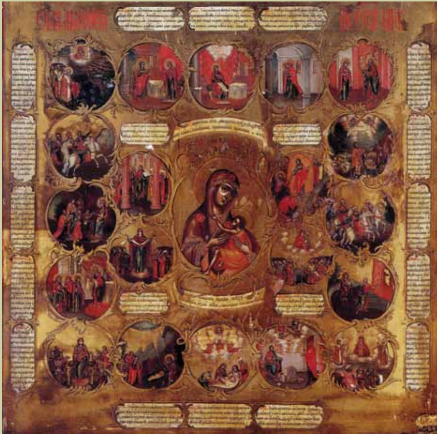
Ил. 1. «Акафист Пресвятой Богородицы». Икона мастерской Богатыревых 1800–1810-е гг.