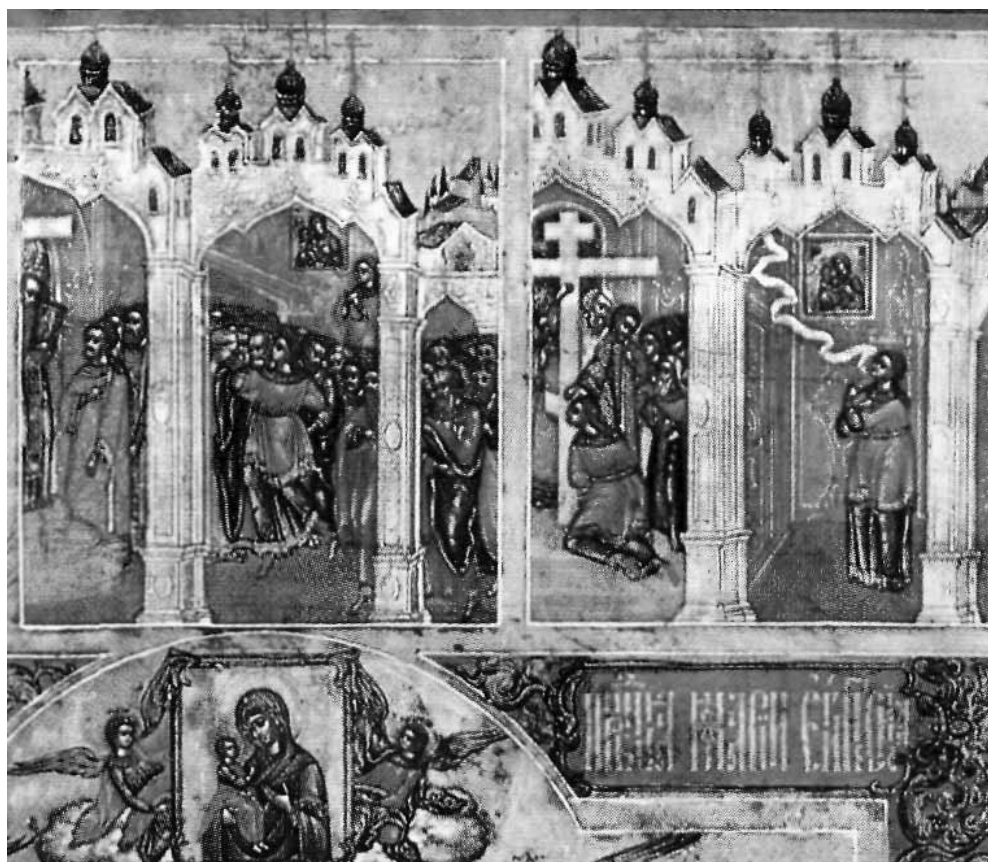
Ил. 5. Прп. Мария Египетская с житием (фрагмент)