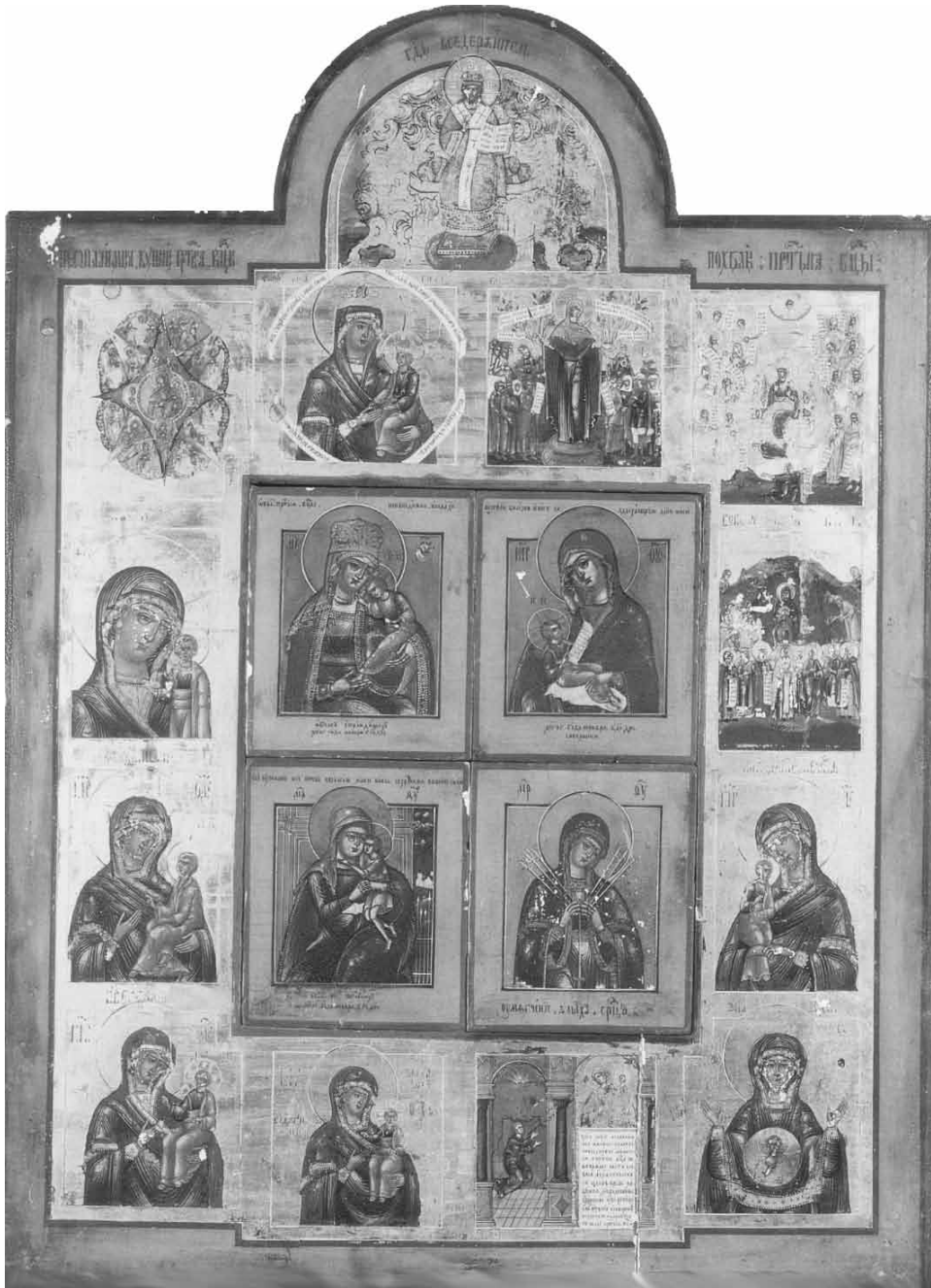
Ил. 9. Собор 16 богородичных икон с образом «Царь царем» в оглавии