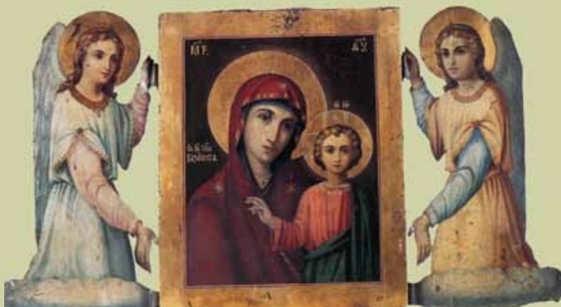
Ил. 2. Икона Богоматери «Казанская», преподносимая ангелами