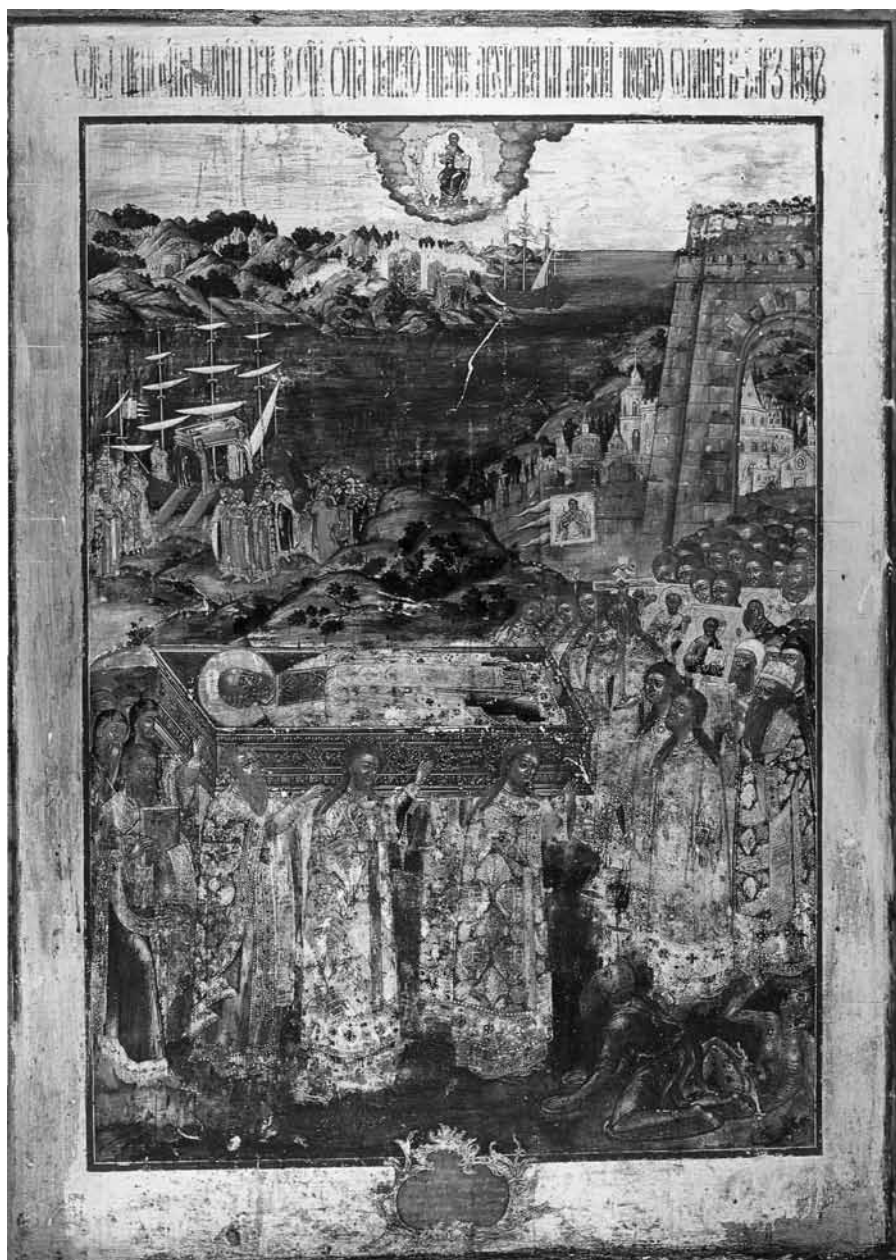
Ил. 7. Перенесение мощей свт. Николая Чудотворца