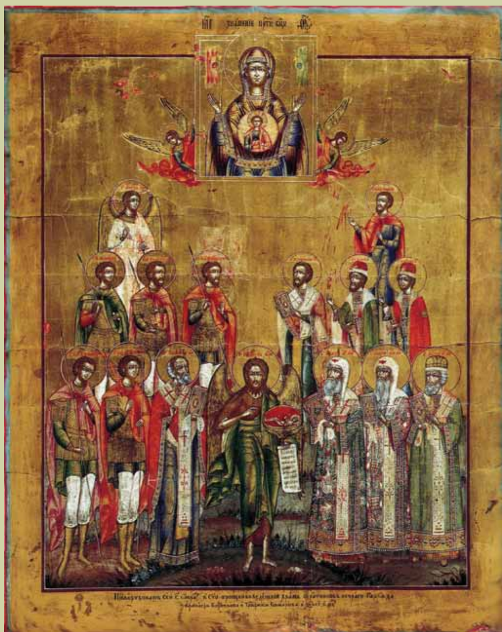
Ил. 3. Собор избранных святых со св. Иоанном Предтечей