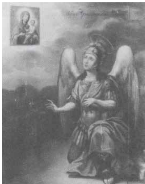
Ил. 12. Архангел Михаил в молении иконе «Богоматерь с Богомладенцем»