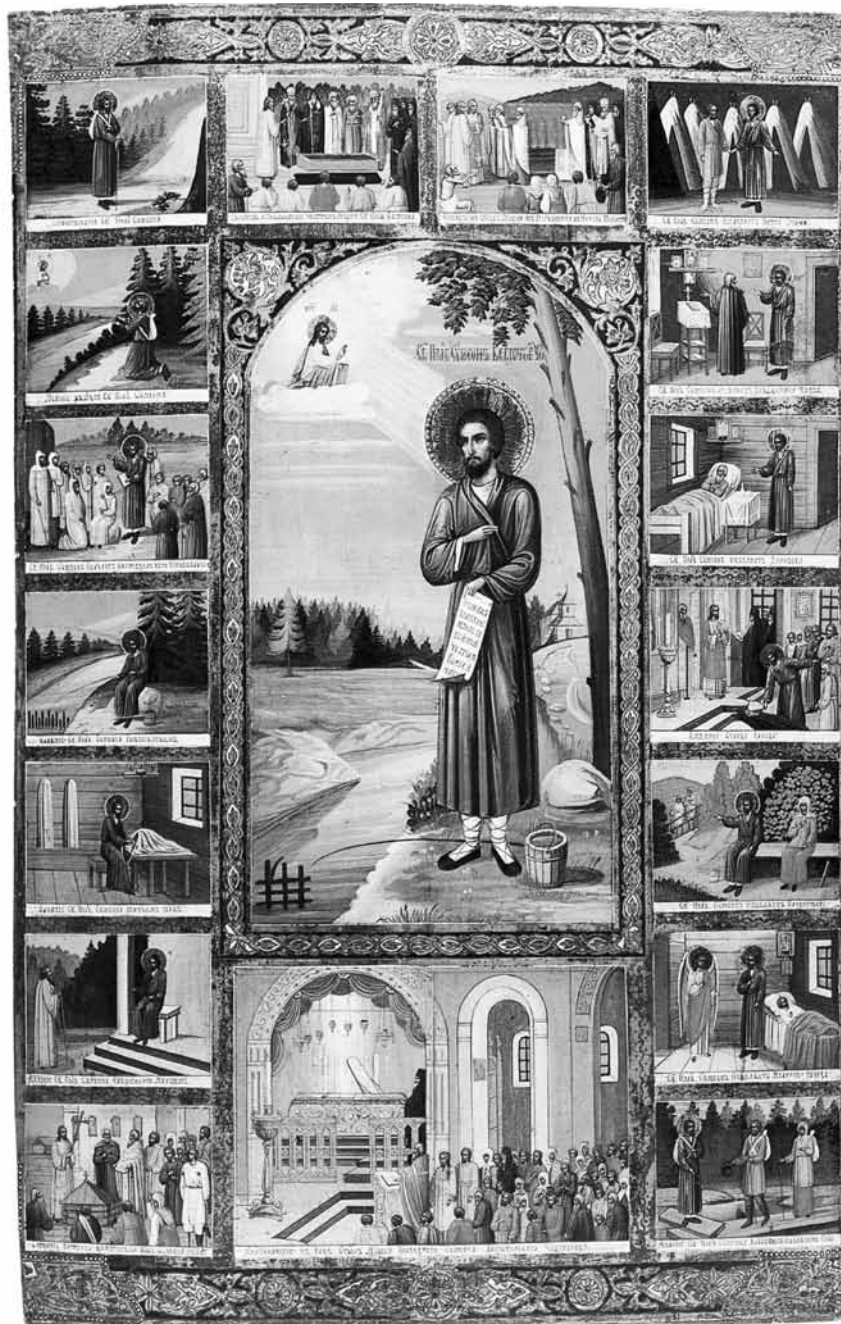
Ил. 10. Св. праведный Симеон Верхотурский с житием