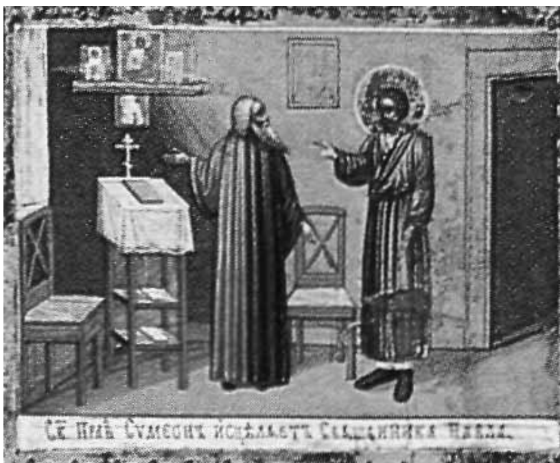
Ил. 11. Св. праведный Симеон Верхотурский с житием (фрагмент)