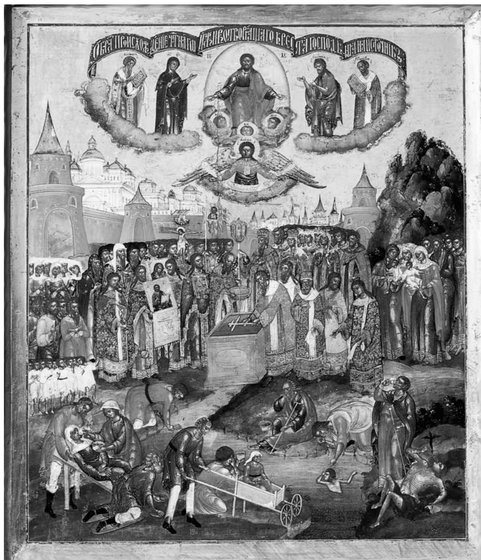
Ил. 6. Происхождение Святого Животворящего Креста Господня на источнике