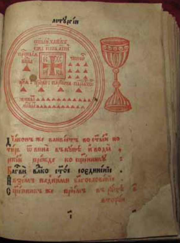
ВПМ РК 3п. СЛУЖЕБНИК С СОБОРНЫМ СВИТКОМ. М., Печатный двор, 17. 05. 1633. Л. 7 verso. сч.-8 recto. сч.