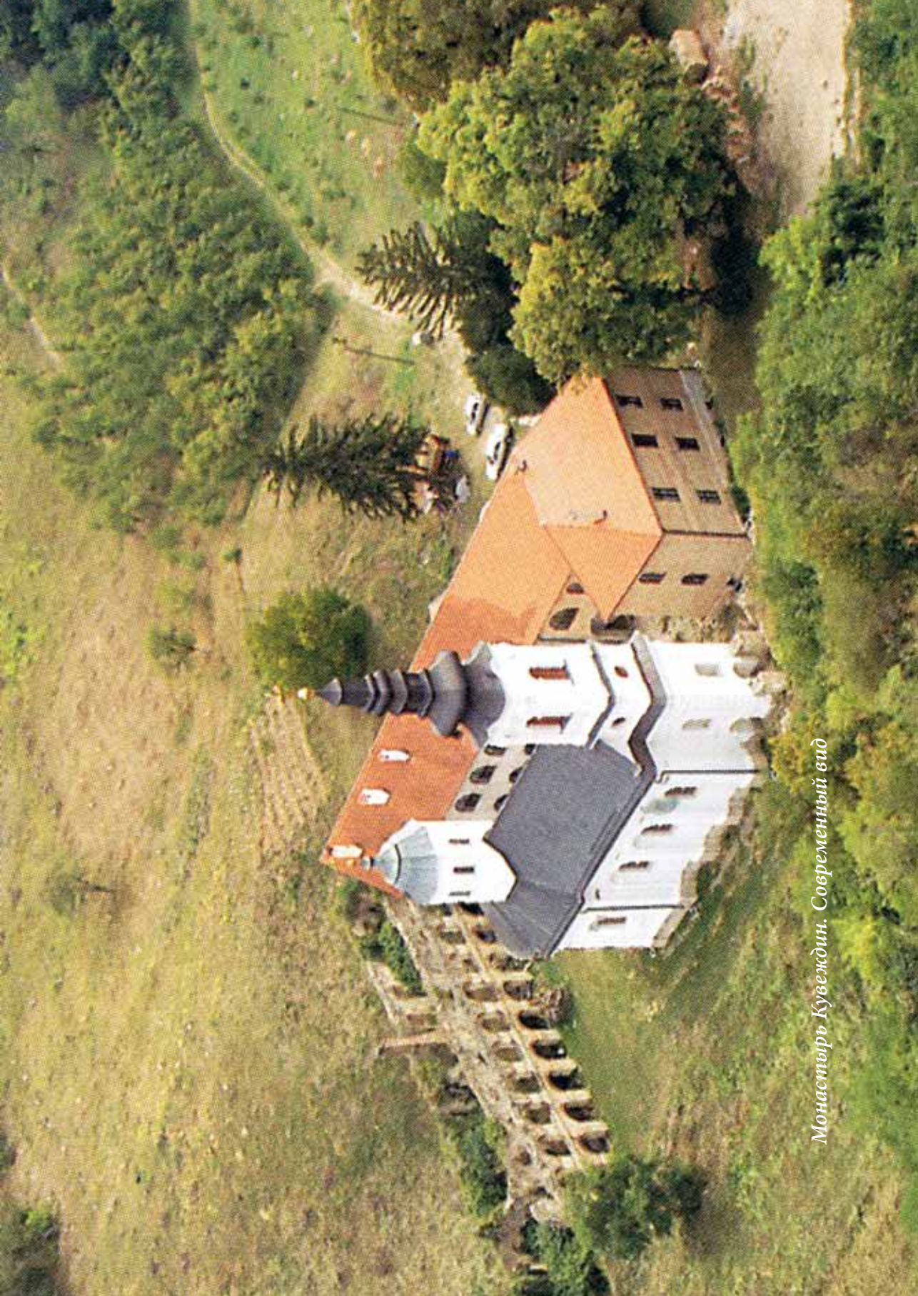
Монастырь Куваждин. Современный вид