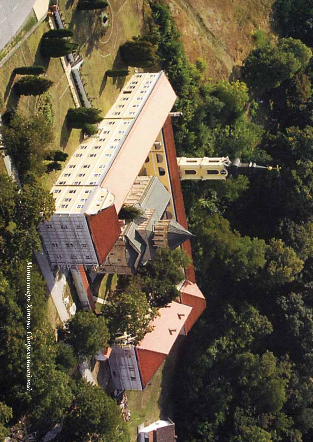
Монастырь Хомово. Современный вид