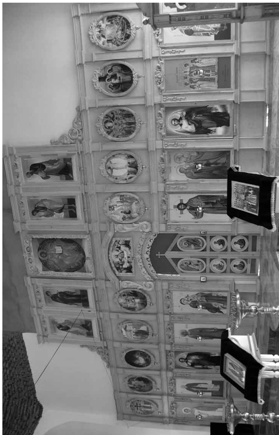
Симеоно-Аннинская церковь. Новый иконостас