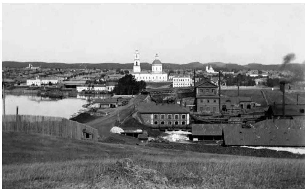
Сысерть. Вид с горы Думной. Фото нач. XX в.