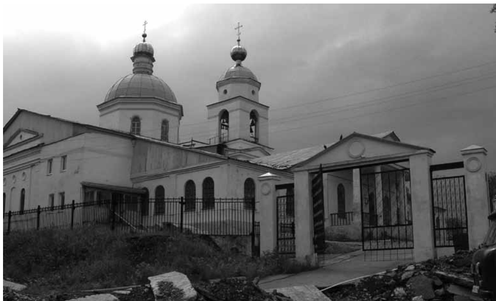
Полевской. Восстановление Петропавловской церкви