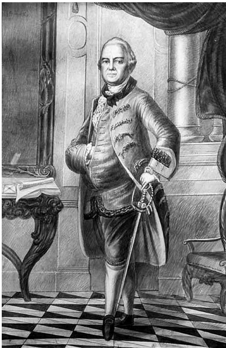
Портрет А. Ф. Турчанинова. Литография нач. XIX в. Полевской краеведческий музей