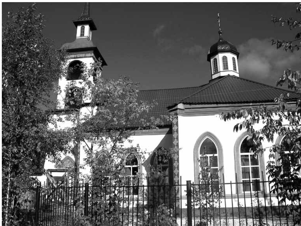
Петропавловская церковь в г. Полевском. Фото 2012 г.