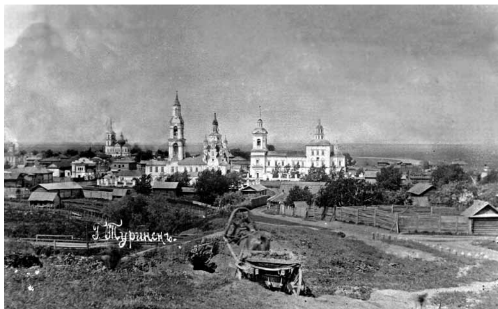
Ил. 2. Сретенская, Покровская, Крестовоздвиженская церкви (слева направо). начало XX в.