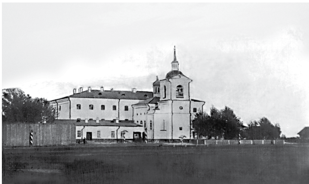
Ил. 5. Церковь во имя святых Константина и Елены в Туринской уездной тюрьме. начало XX в.