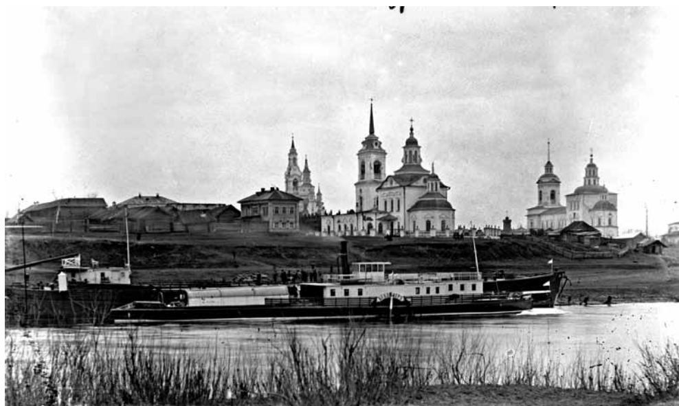
Ил. 3. Покровская, Спасская, Крестовоздвиженская церкви (слева направо). начало XX в.