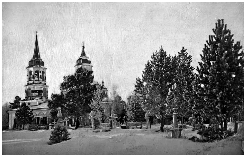
Ил. 4. Кладбищенская церковь в честь Сошествия Святого Духа. начало XX в.