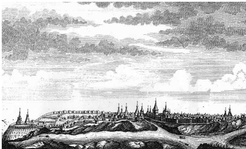
Ил. 1. Туринск, середина XVIII в. Гравюра П. Т. Балабина. 1770 г.