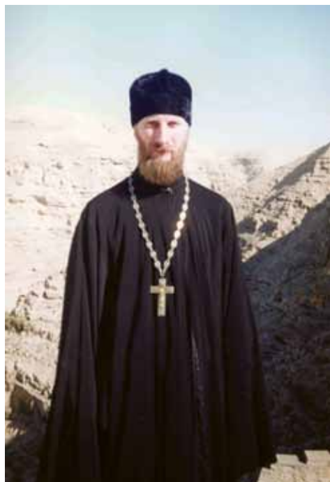
В паломнической поездке по Святой Земле. 2005 г.