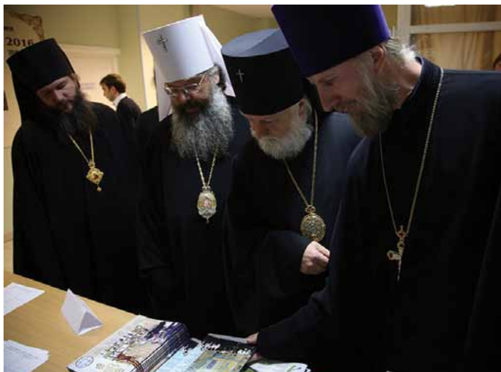
Перед конференцией, посвященной 100-летию семинарии. 22 октября 2016 г.