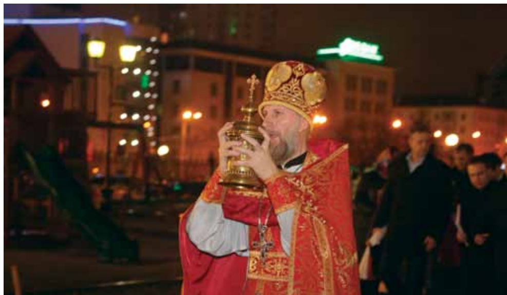
На крестном ходе в пасхальную ночь. 16 апреля 2017 г.