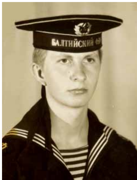
Во время службы в ВС. 1985 г.