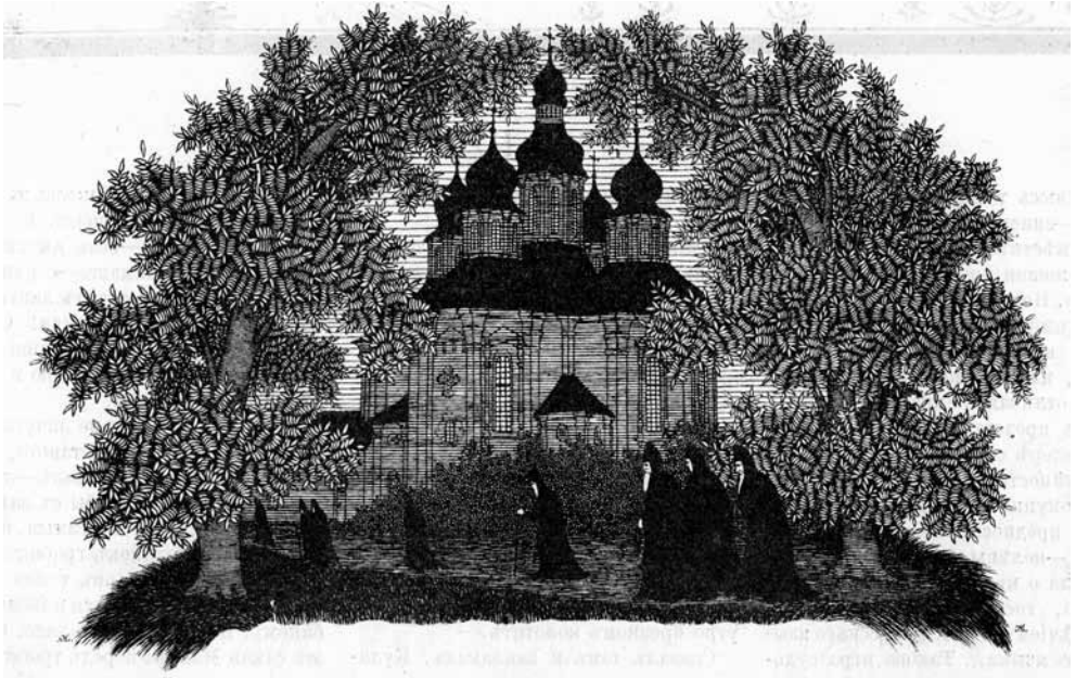
Валаамские монахи идут в монастырский собор. Опубл. в: Лукоморье. 1915. № 40 (3 октября). С. 1

Святая Русь воскреснет! Вера же побеждает безбожие! Близится время, когда русский народ скажет — «довольно! Мы не хотим жить без Бога, без веры, без молитвы!» И снова восстановятся в России храмы и монастыри! И понесется по русской земле праздничный колокольный трезвон! И начнется снова открытое прославление русским народом Христа Спасителя и Божией Матери, и свв. Угодников Николая Чудотворца, преподобного Сергия, преподобного Серафима!