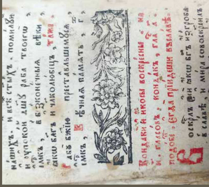
Ил. 6. Не отмеченная в альбомах орнаментики книжной заставка (РК ЕДС № 47605. Часовник. [Сурастль: Титография Благовещенского униатского монастыря, 1788]. Л. 188 об.)