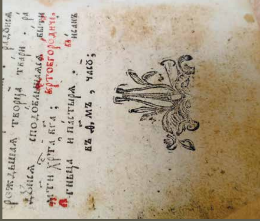
Ил. 7. Не отмеченная в альбомах орнаментики книжная концовка

(РК ЕДС № 47605. Часовник. [Супрасль: Типография Благоевцевского униатского монастыря, 1788]. Л. 102 об.)