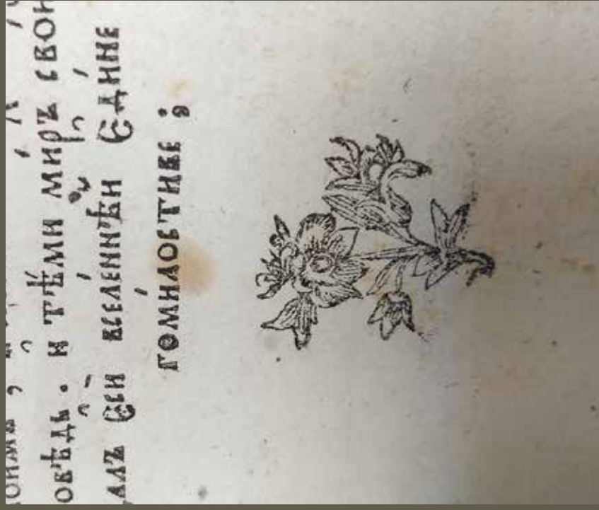
Ил. 8. Не отмеченная в альбомах орнаментики книжная концовка

(РК ЕДС № 47605. Часовник. [Супрасль: Типография Благоевцевского униатского монастыря, 1788]. Л. 102 об.)