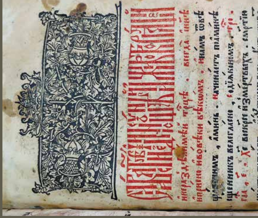
Ил. 2. Конволют (XVII в.). Заставка на л. 236 (РК ЕДС № 65773. Триодъ Цветная. М.: Печатный двор, 06.12.1635)