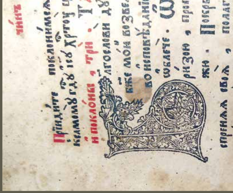
Ил. 4. Книжный инициал (РК ЕДС № 26104. Часослов. М.: Печатный двор, 06.12.1653. Л. 77 об.)