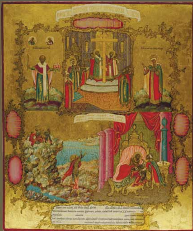
Икона «Воздвижение Креста, с дополнительными сюжетами». Иконописцы Богатыревы. Невьянск, 15 марта 1843 г. Частное собрание