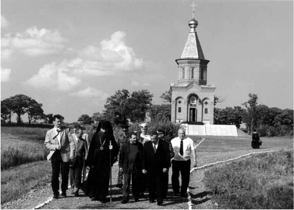
Глава Администрации Хабаровского края Виктор Ишаев (справа в костюме) на Большом Уссурийском острове

После торжественного открытия моста официальная делегация края на трех вертолетах отправилась на Большой Уссурийский остров на церемонию открытия пограничного православного храма-часовни святого воина-мученика Виктора, рядом с которым была обустроена вертолетная площадка 13 .