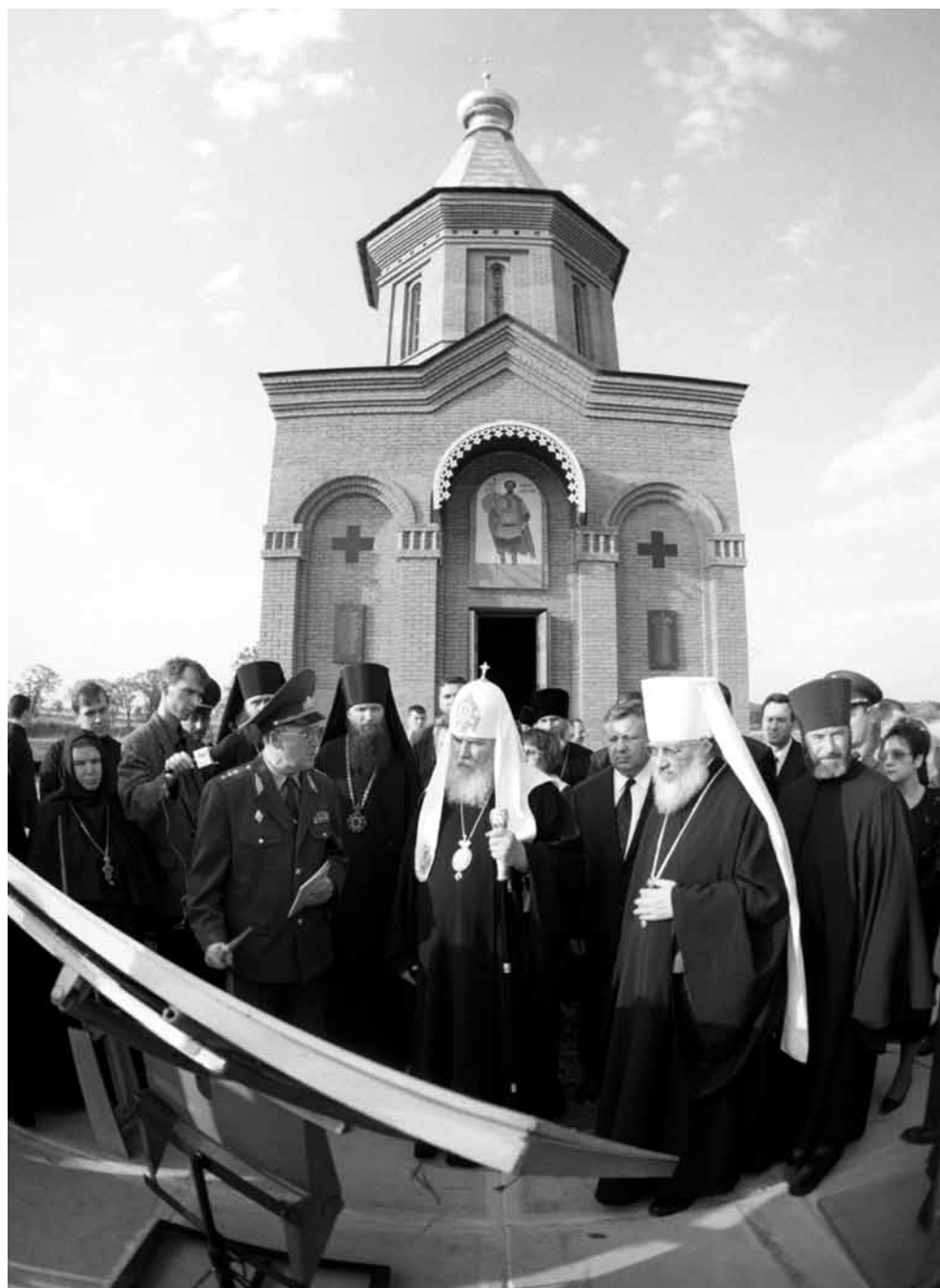
Патриарх Московский и Всея Руси Алексий II возле пограничного православного храма-часовни святого мученика-воина Виктора на Большом Уссурийском острове 20 мая 2000 г.