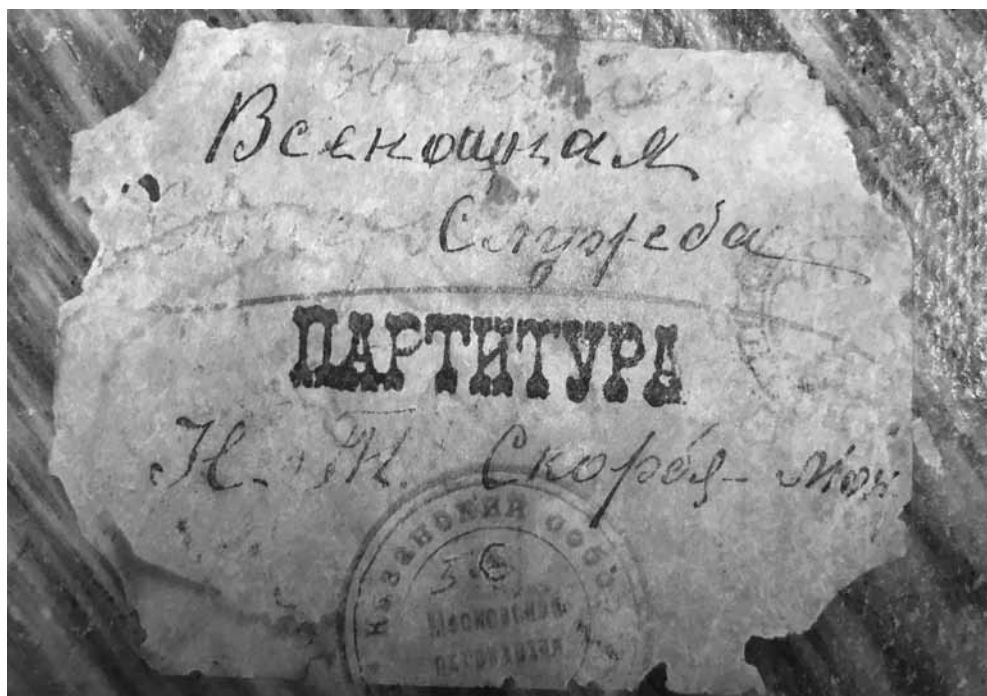
Ил. 1. Ярык «Всенощная Служба. Партитура Н.-Т. Скорбя[щенского] мон[астыря]». ЕДС РК № 43200