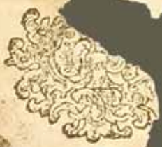
Ил. 4. Выходные данные книги (РК ЕДС № 64973. Часослов. М.: Синодальная типография, 07.1769. Тит. л. об.)

ПЕРЧАТАНА КНИГА СІА ЧАСОСЛОВ ВЪ ЦРТВОУЩЕМЪ ВЕЛИКОМЪ ГРАДѢ МОСКВѢ , ВЪ ЛѢТО Ш СОТВОРЕ НІА СВІТА *ВСОЗ , Ш РЖТВА Ш ПО ПЛОТИ БГА СЛОВА *АШ *ДА ІНДИКА Б МЦА ІУЛІА .