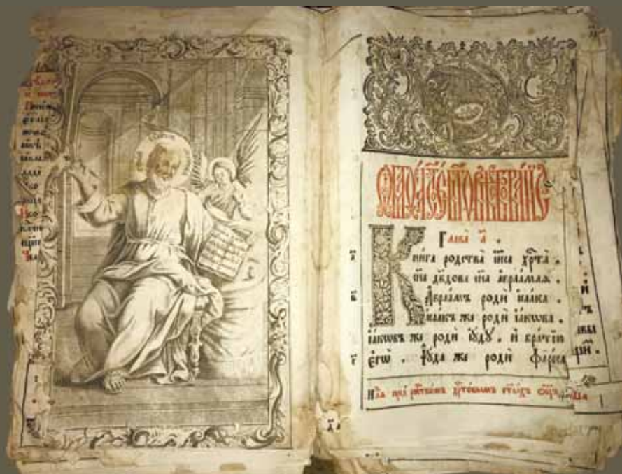
ВПМ РК 720 п. Евангелие. М.: Синодальная типография, 05.1774. Л. 13 об. – 14