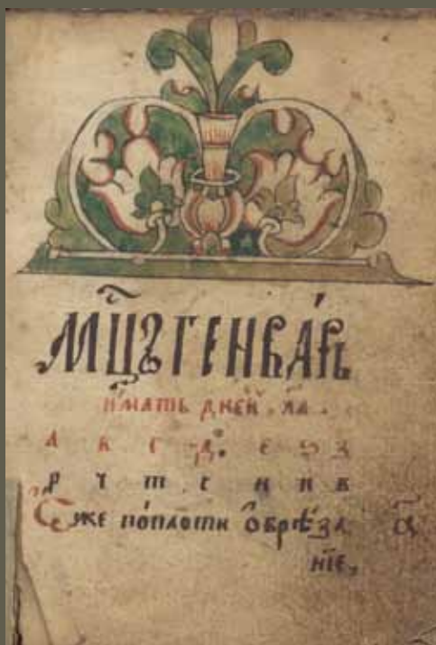
Месяцеслов. Рукопись, ок. 1737 г. Л. 6 об. – 7. ЦНБ УрО РАН. № 150648-мф