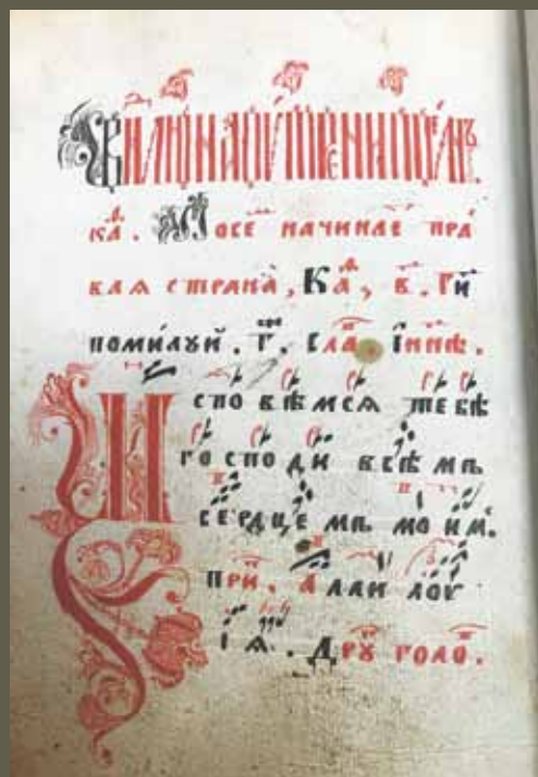
Обиход. Рукопись, нач. XIX в. Л. 275 об. ЦНБ УрО РАН. № 217791-мф