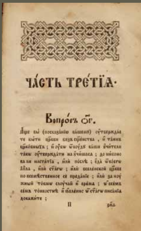
Миня служебная, май. М.: Печатный двор, 4.12.1626. Л. 464 об. и переплетный в конце книги. ЦНБ УрО РАН. № 150647-мф