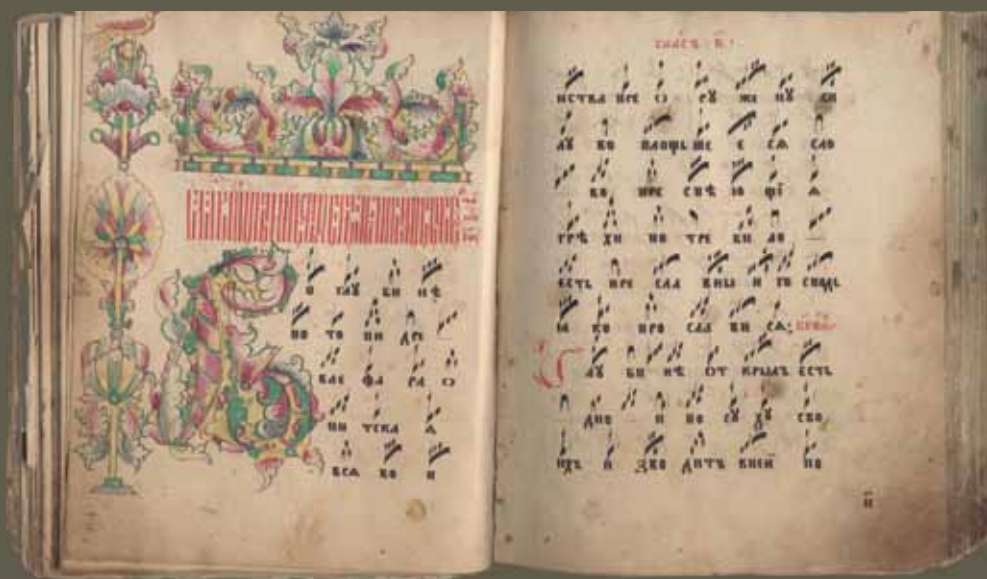
Ирмологий. Рукопись, 50–80-е гг. XIX в. Л. 50 об. – 51. ЦНБ УрО РАН. № 150646-мф