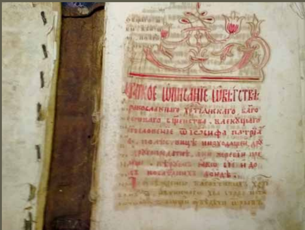
Сборник сочинений старообрядцев часовенного согласия. Рукопись нач. XX в. ЕДС. Инв. № 64975. Л. 1.