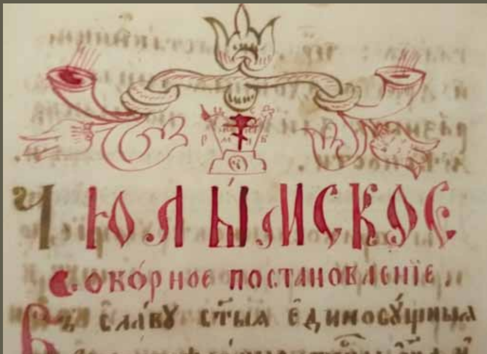
Сборник сочинений старообрядцев часовенного согласия. Рукопись нач. XX в. ЕДС. Инв. № 64975. Л. 149.