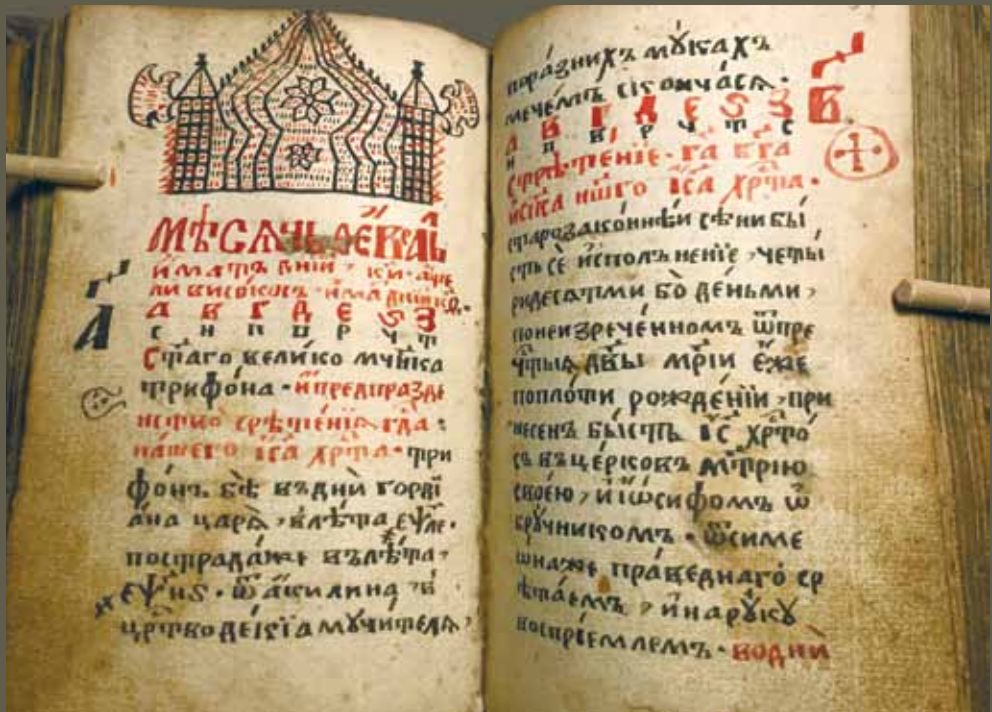
Святцы с летописью. Рукопись ок. 1707 г. ЕДС. № 52259. Л. 96 об. – 97