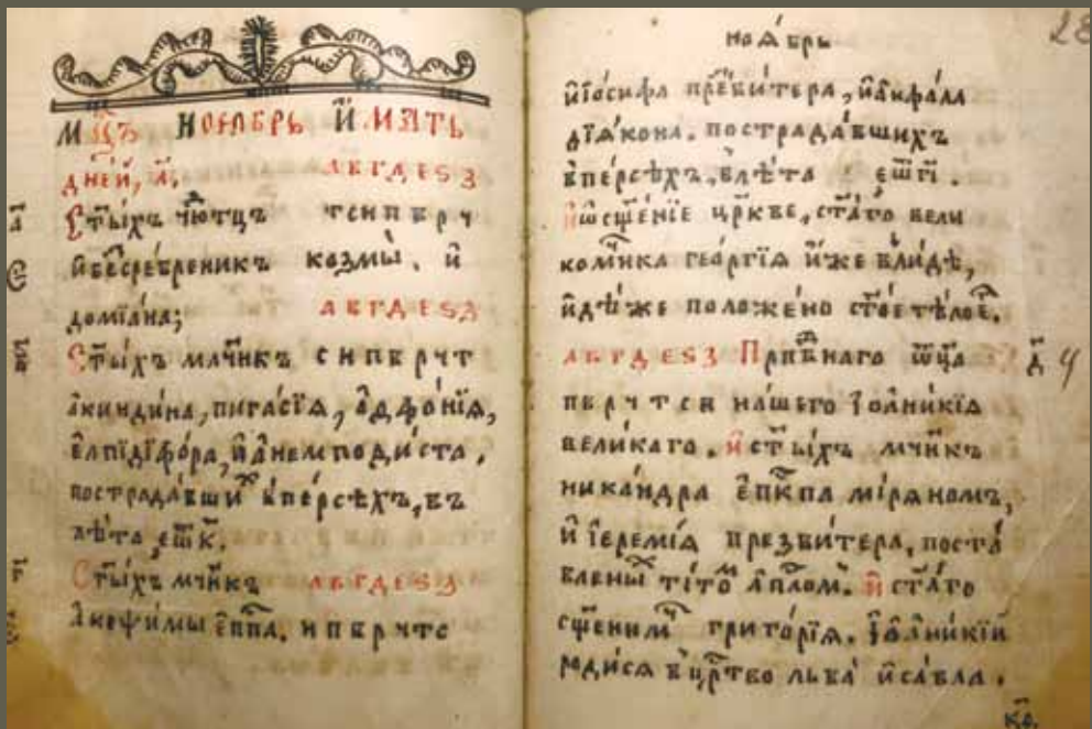
Святцы с летописью. Рукопись ок. 1891 г. ЕДС. № 52260. Л. 27 об. – 28