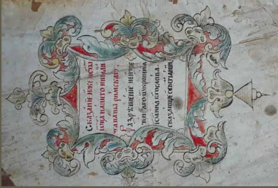
Ил. 1. Заставка-рамка к «Слову Ипполита папы Римского...». ИРиСК. № 222 р. Оборот переплета