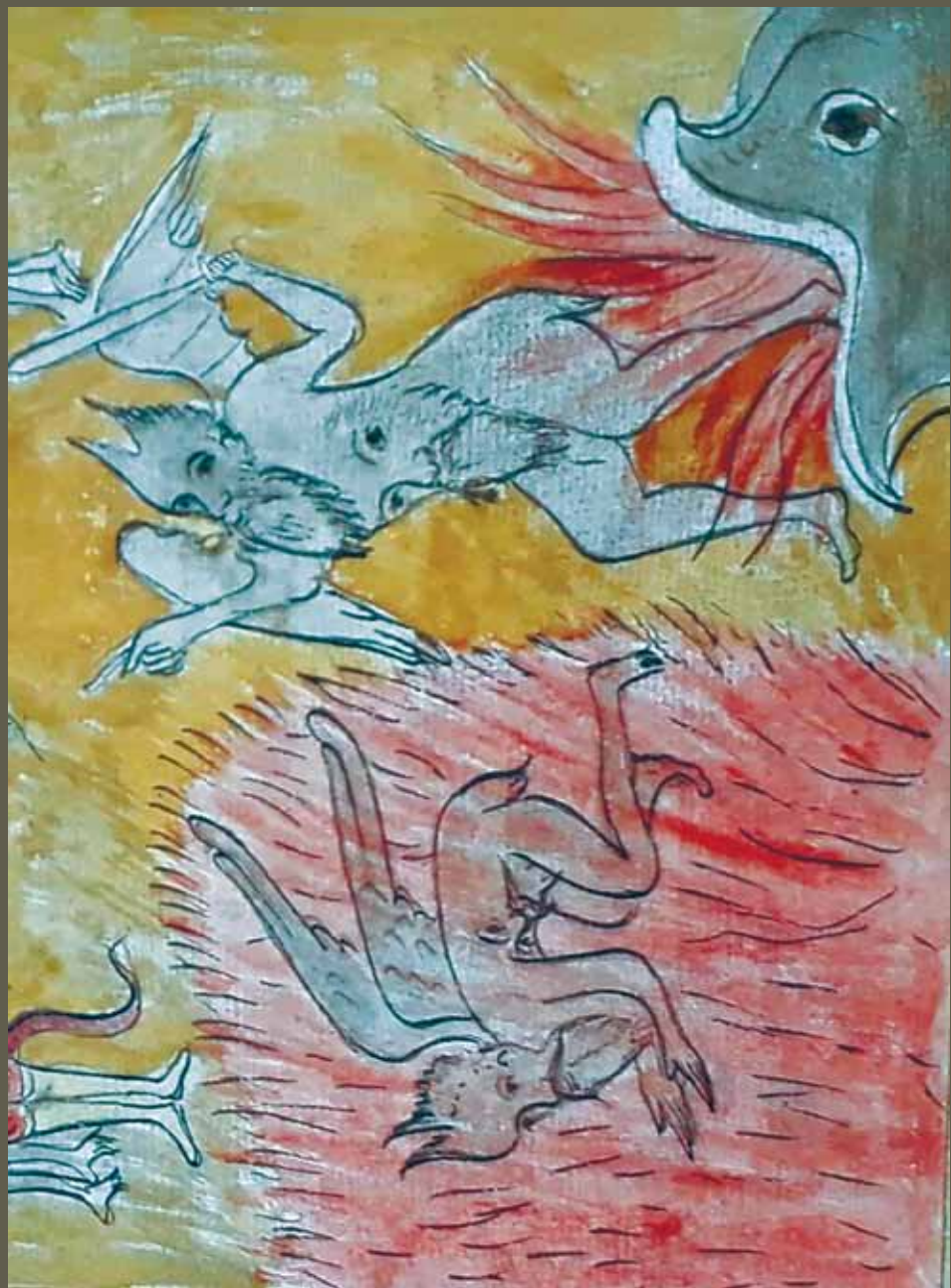
Илл. 7. Низверженные в огненное озеро «вражьи силы», ИРиСК. № 222 р. Л. 122 об.