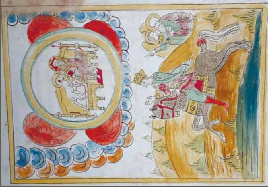
Ил. 5. Видение всадника на белом коне. ИРиСК, № 222 р. Л. 40 об.