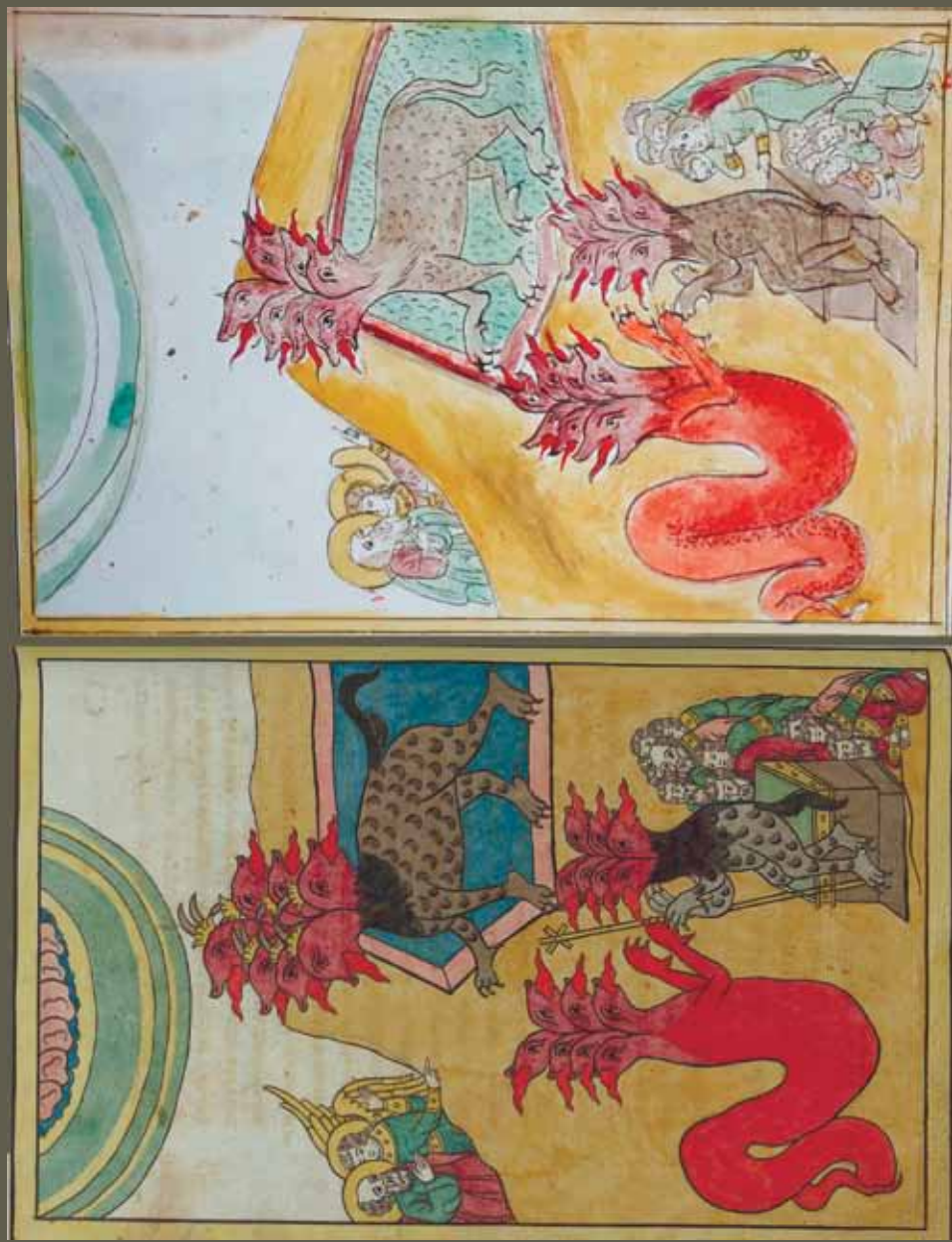
Илл. 10. «И видех из моря зверь исходящ...». Слева: Варшавская нац. б-ка. № 12372. С. 85 об. Справа: ИРиСК. №222 р. Л. 75 об.