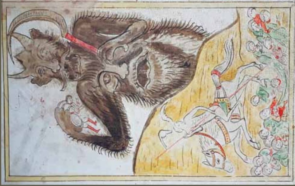
Ил. 8. Видение всадника на бледном коне. ИРиСК. № 222 р. Л. 43 об.