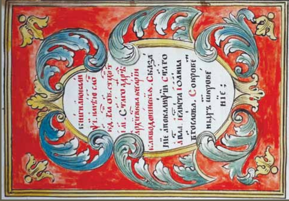
Ил. 2. Заставка-рамка к предисловию Андрея Кесарийского. ИРиСК. № 222 р. Л. 5 об.