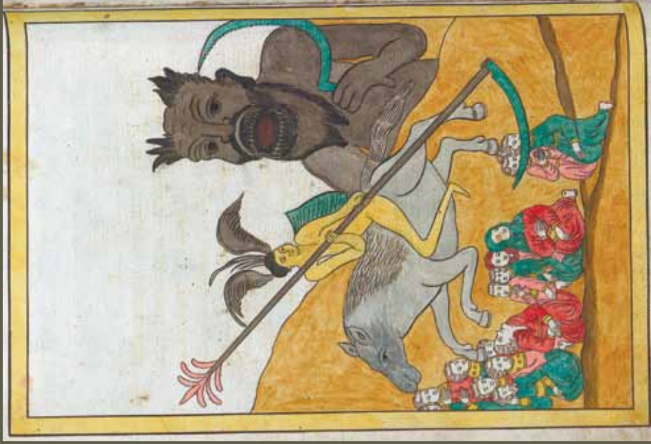
Ил. 9. Видение всадника на бледном коне. Варшавская нац. б-ка. № 12372. С. 45 об.