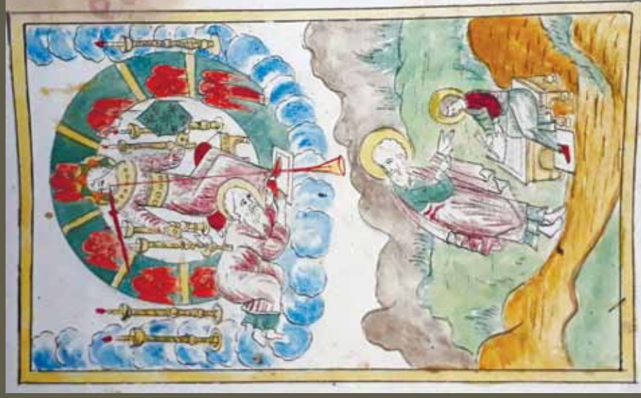
Ил. 4. Видение посреди семи светильников. ИРиСК. № 222 р. Л. 16 об.