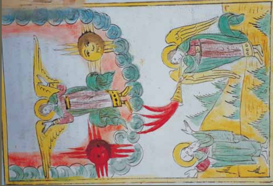
Ил. 6. «Четвертый ангел вострубил...». ИРиСК, № 222 р. Л. 56 об.