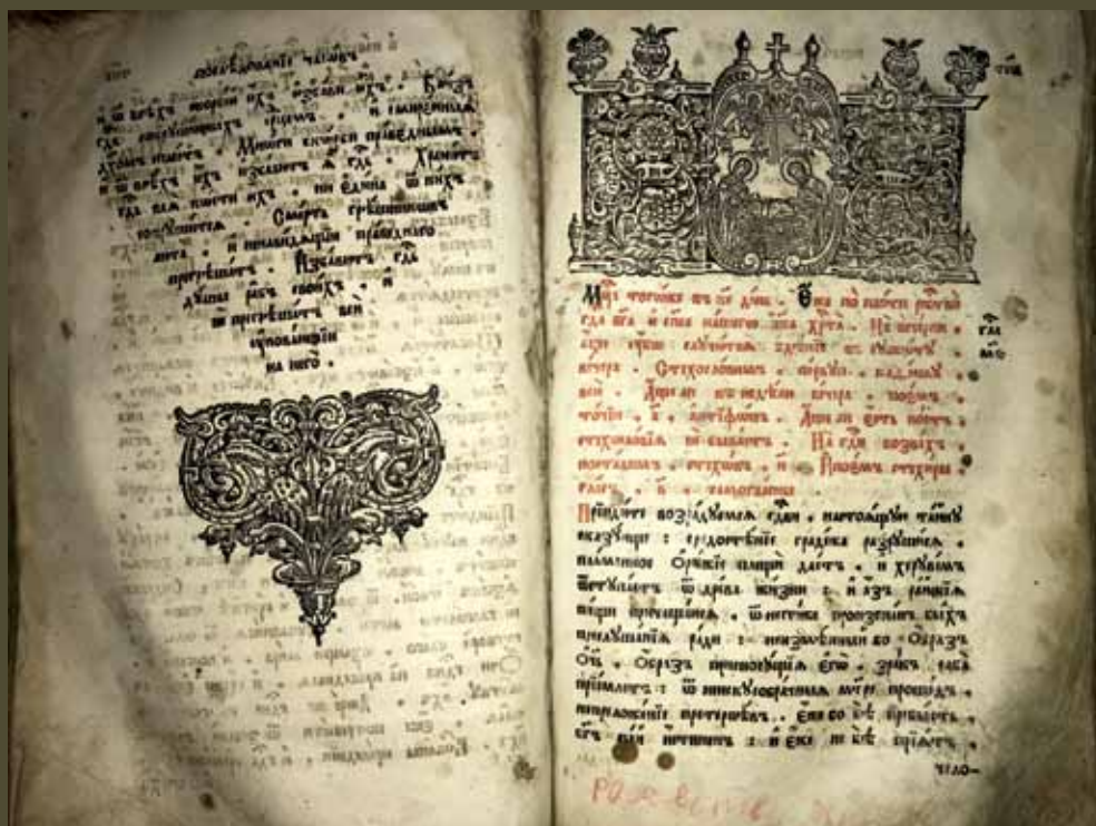
ВПМ РК. 719 п. Минея общая с праздничной. М.: Печатный двор, 08. 1681. Л. 351 об. – 352 втор. сч.