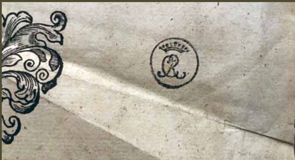
Владельческий штамп (ВПМ РК. 726 п. Пролог: в 2-х ч. М.: Синодальная типография, 03.1752. Ч. 2: Март — август. Л. 689 перв. сч.).